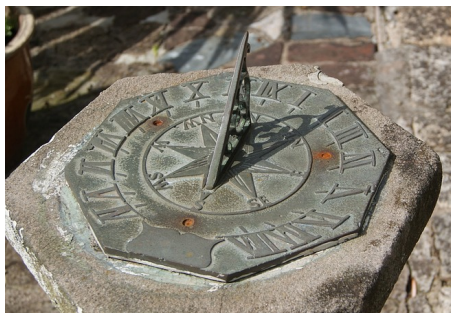
Obrázek 1: Slnčné hodiny 3

Na meranie kratších časových úsekov a v časoch, keď bolo zamračené sa používali rôzne iné metódy, ako napríklad presýpacie hodiny, doba horenia sviečky, či výtoku vody z nádoby. Tieto metódy mali obvykle výrazne menšiu presnosť na dlhšej časovej škále. Napríklad, pre vodné hodiny s dlhou výtokovou trubicou pri zmene teploty vody už o jeden stupeň Celzia dôjde vplyvom zmeny viskozity, a teda prietoku, k chybe merania času o pol hodiny za deň.